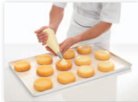
VANILLE-KOCHCREME VERLEIHT IHREN GEBÄCKEN DEN CREMIGEN PFIFF.

Hohe Verarbeitungstoleranz kein Auswässern bei der Lagerung