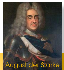
August der Starke

® Die Bezeichnungen ZACHARIAS und STOLLEN-ZACHARIAS sind für Wettbewerbe und Backwaren geschützt.